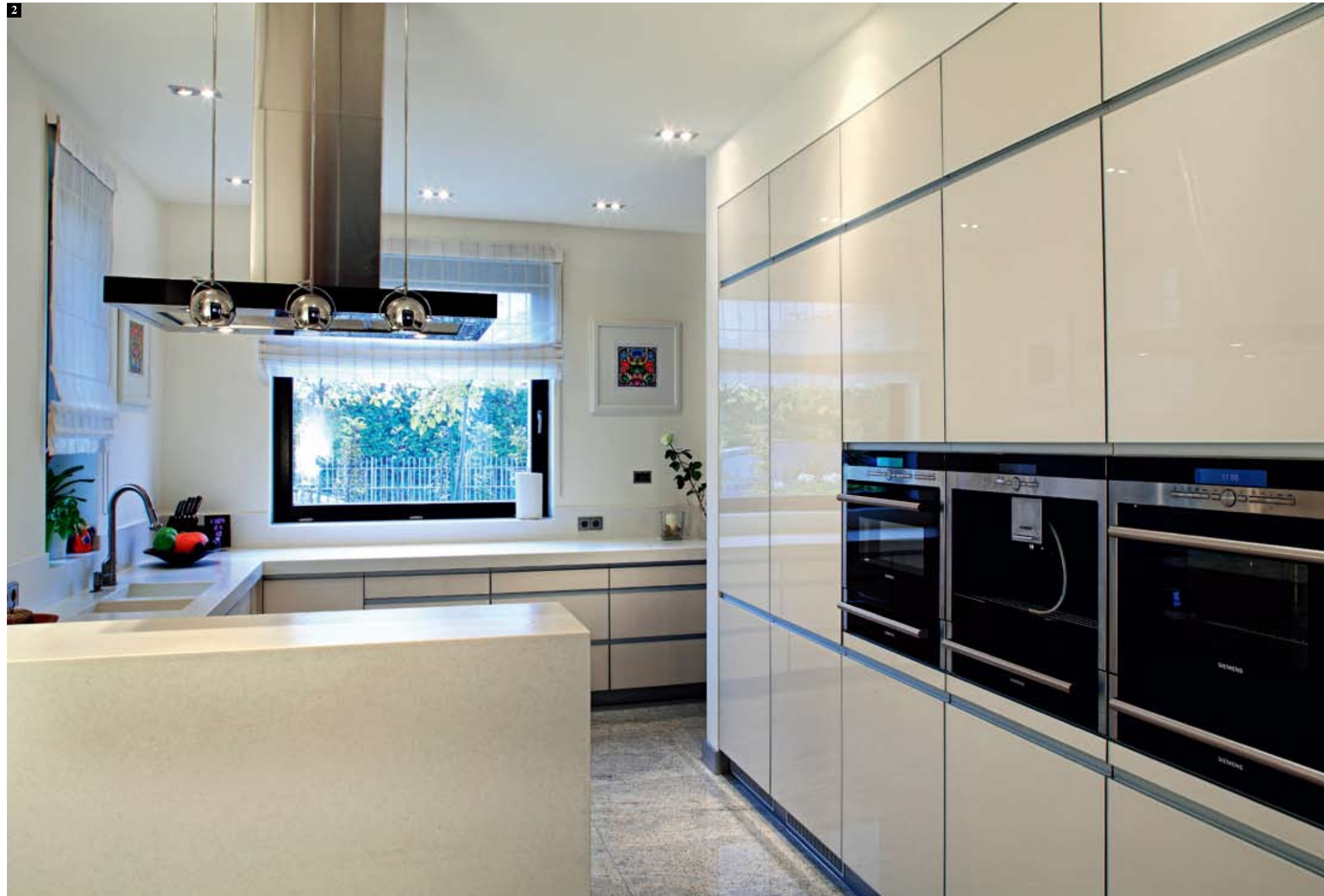
图1 卫生间内整体墙壁和洗手台选用了红色石灰华的地质，下面的储物柜材质依然是彩色橡木，这间住宅中的两种主要色彩终于在这里交汇了。 图2 由浅米黄色可丽耐人造大理石和玻璃这两种材质相结合打造出的组合橱柜，看起来非常轻盈；设计简单的独扇窗户，也让厨房更加的透亮了。